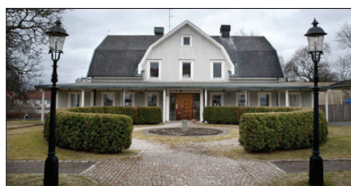
20 lägenheter var för mycket, ansåg länsstyrelsen. Nu gör fastighetsbolaget Bofast ett nytt försök med elva lägenheter i Bäckalycke herrgård. Kommunen har godkänt bygglovet.

Peter Lindström peter.lindstrom@jonkopingsposten.se