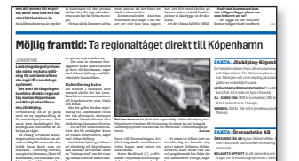
Jönköpings-Posten 5 maj 2012.

I upphandlingen avgörs vilken operatör som från december 2014 ska köra